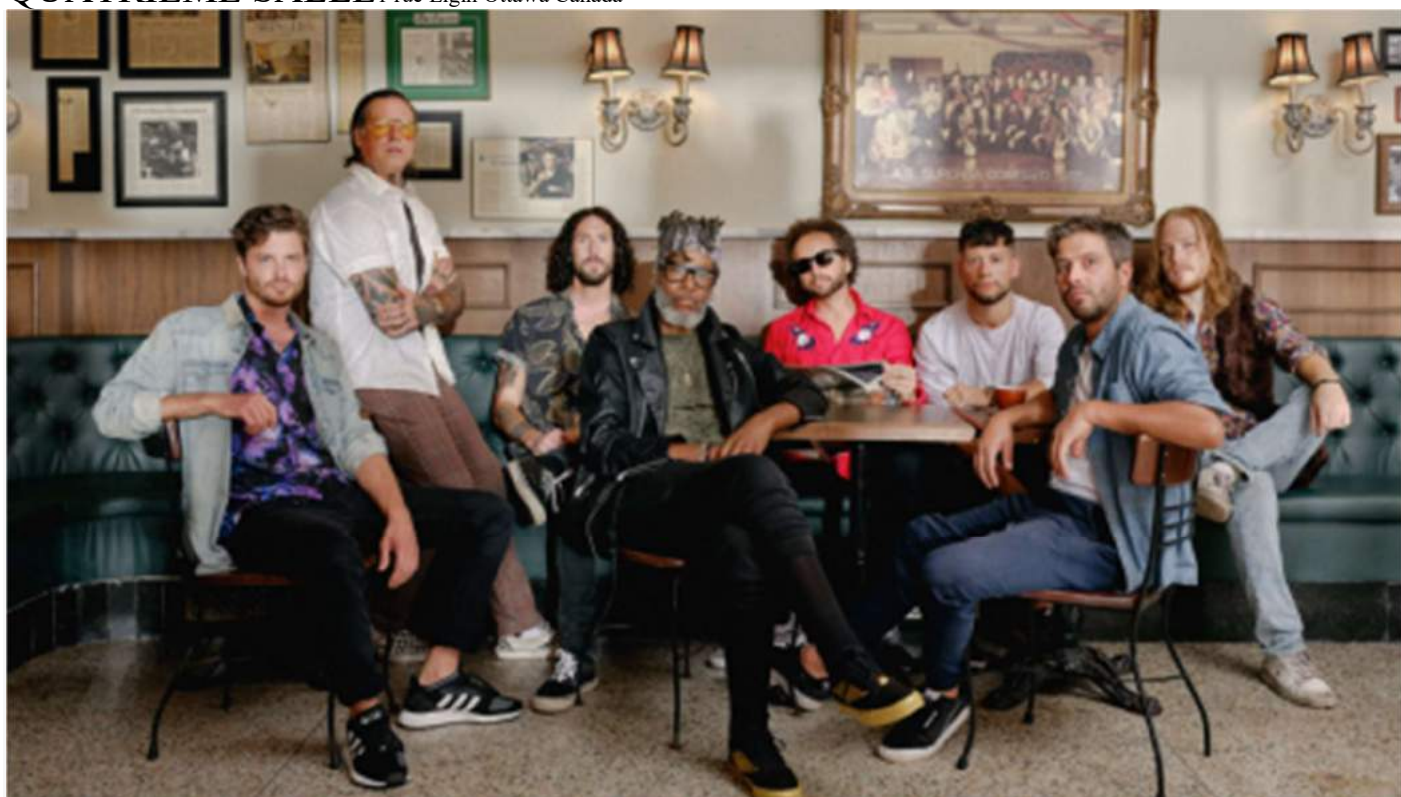
The Brooks

QUATRIÈME SALLE 1 rue Elgin Ottawa Canada