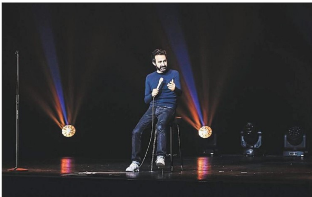
Mathieu Madenian en tenue de scène, jean et baskets blanches, lors de son dernier one-man-show, « un spectacle familial ».

Le terme familial est à prendre dans le sens général : réunion de famille, apéritif, repas parfois alcoolisé. Ça implique des jalousies, des vexations mal digérées. Ce sont les moments où l'on aborde tous les sujets : la pandémie, les antivax, la GPA (gestation pour autrui) mais aussi Marion Maréchal, Zemmour, la fin du monde... J'aborde aussi des choses plus sympas comme la relation parents-enfants.