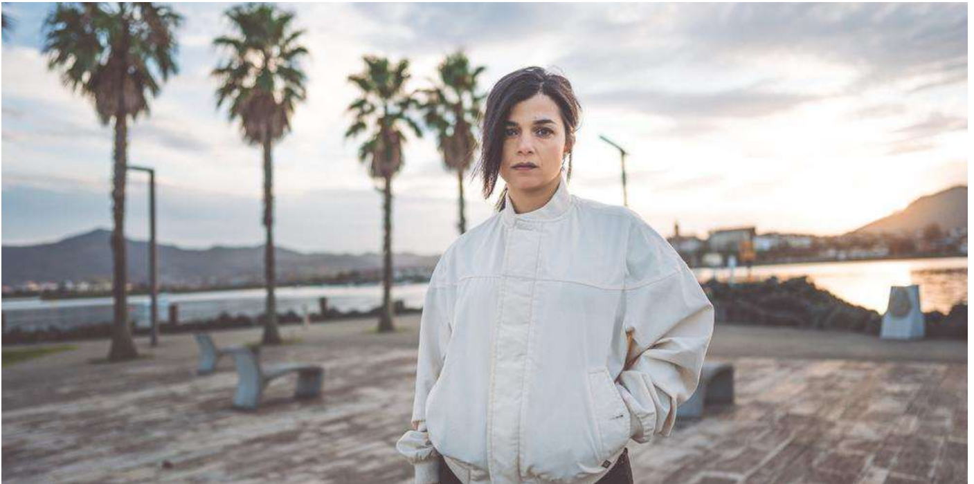
Julie Gil.