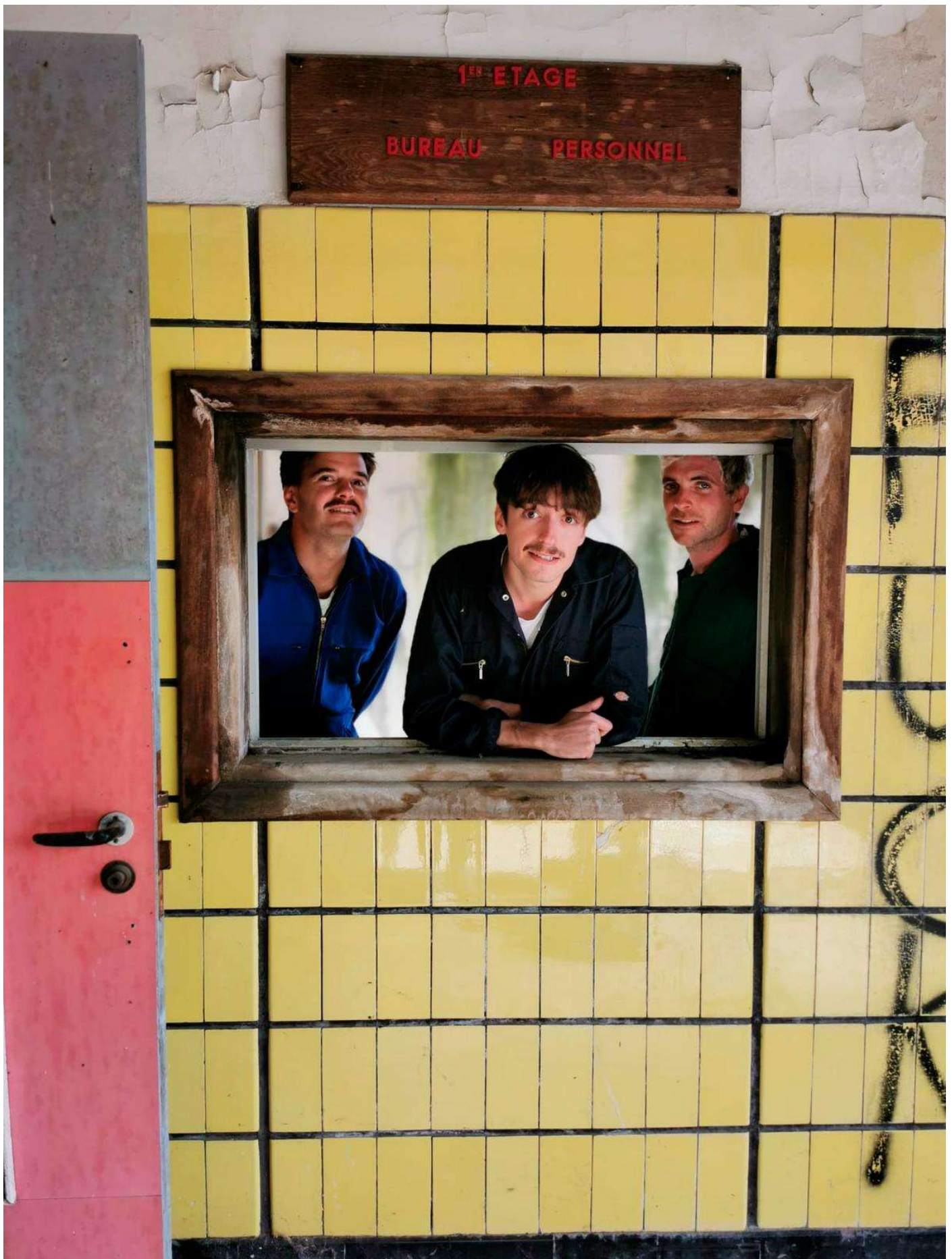
Foudre du Bengale et son esprit pop. Foudre du Bengale