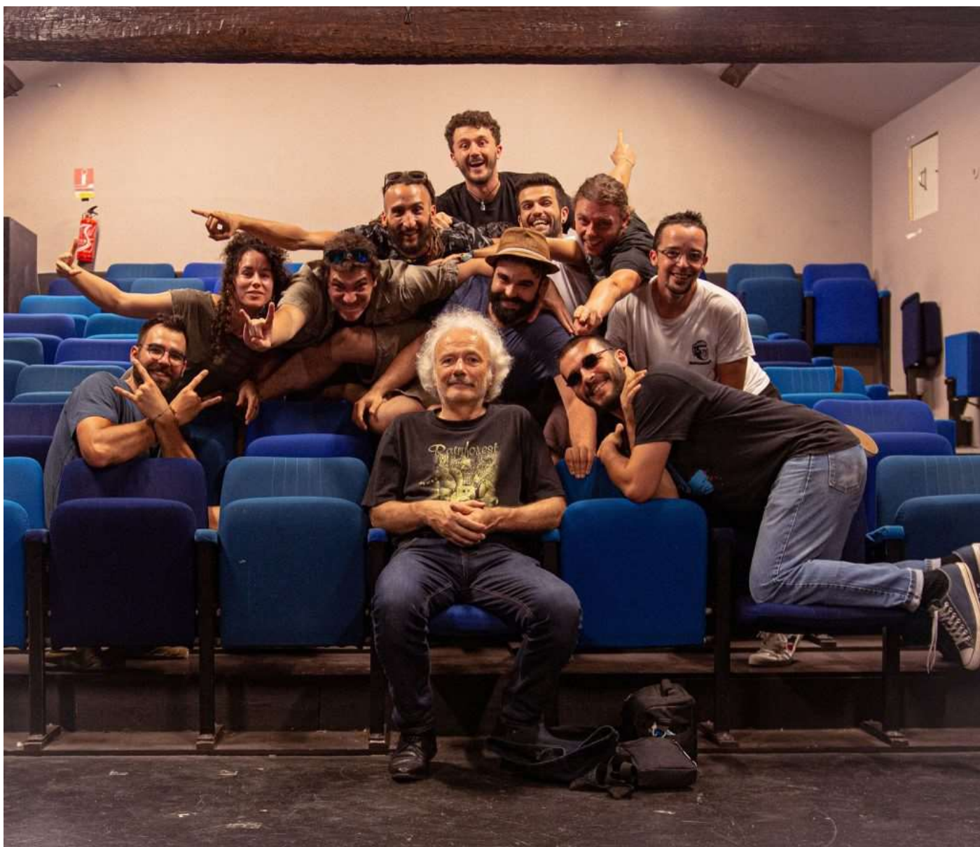
Une équipe au TOP ! Et oui un tel projet c'est beaucoup de monde, devant et derrière