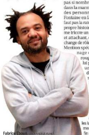
Fabrice Éboué, Grand Point-Virgule

Du 4 au 7 janvier 2023 au Théâtre de la Renaissance (X e ), à partir de 22 €.