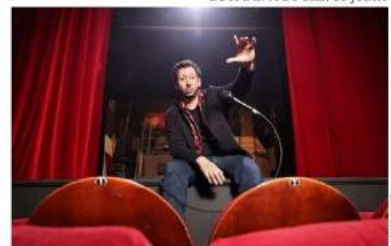
Dans « Nombri », son premier one-man-show, Monsieur Poulpe revient sur son parcours atypique dans une mise en scène décalée.