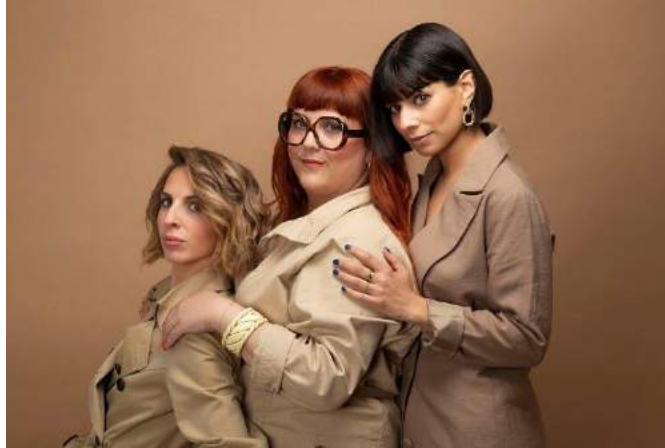
Le trio se produira à l'Espace L.A.C de Gérardmer le 14 avril prochain.

Le trio musical et humoristique Les Coquettes se produira à l'Espace L.A.C de Gérardmer le 14 avril prochain.