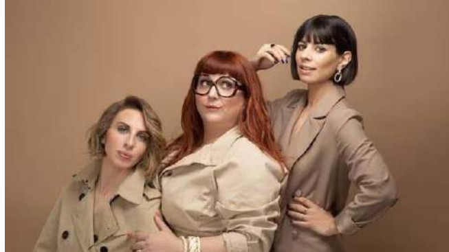
Les Coquettes seront en spectacle à Ploërmel (Morbihan).

Les Coquettes vont donner le coup d'envoi de la saison culturelle Arth Maël 2023 de Ploërmel communauté, ce vendredi 22 septembre 2023, à la salle Monoroë de Mauron (Morbihan). Rencontre avec ce trio féminin qui enchaîne sketches et chansons sur scène.