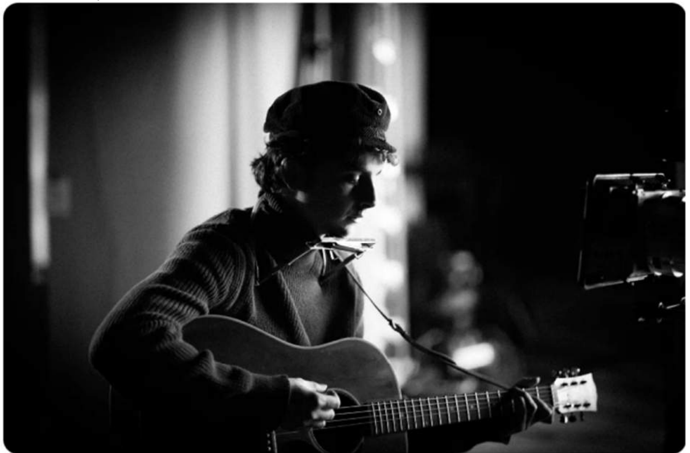
Un parfait inconnu - James Mangold

Résumé : New York, 1961. Alors que la scène musicale est en pleine effervescence et que la société est en proie à des bouleversements culturels, un énigmatique jeune homme de 19 ans débarque du Minnesota avec sa guitare et son talent hors normes qui changeront à jamais le cours de la musique américaine. Durant son ascension fulgurante, il noue d'intimes relations avec des musiciens légendaires de Greenwich Village, avec en point d'orgue une performance révolutionnaire et controversée qui créera une onde de choc dans le monde entier..