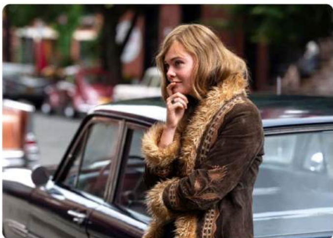
Un parfait inconnu Elle Fanning - Macall Polay