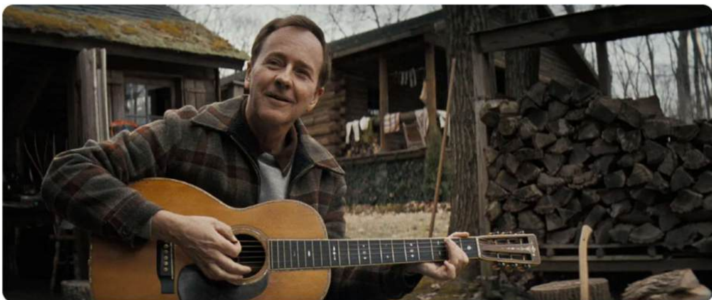
Un parfait inconnu Edward Norton