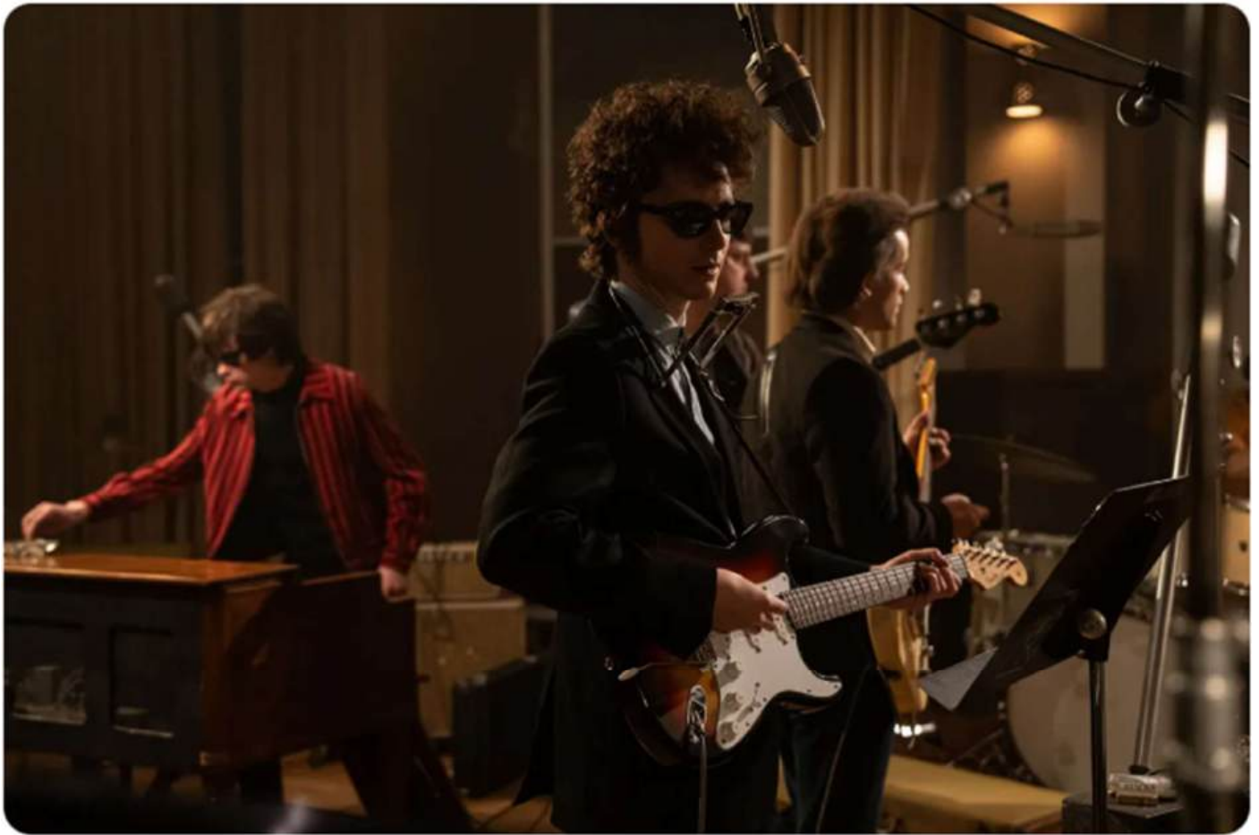
Un parfait inconnu