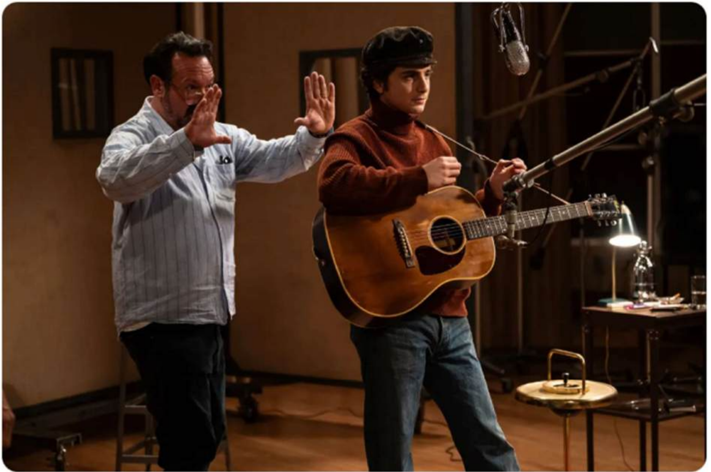
Un parfait inconnu James Mangold et Timothée Chalamet

Ecrit par James Mangold ( Le Mans 66 , Logan ) et Jay Cocks ( Silence , Gangs of New York ), Un parfait inconnu retrace la fulgurante ascension de Bob Dylan de 1960 jusqu'aux plus grandes salles de concerts et au sommet des hit-parades :