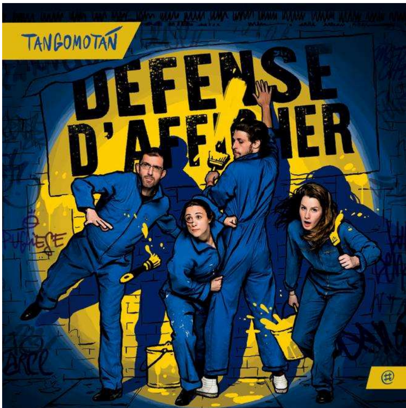
Pochette de l'album "Défense d'afficher", de Tangomotán